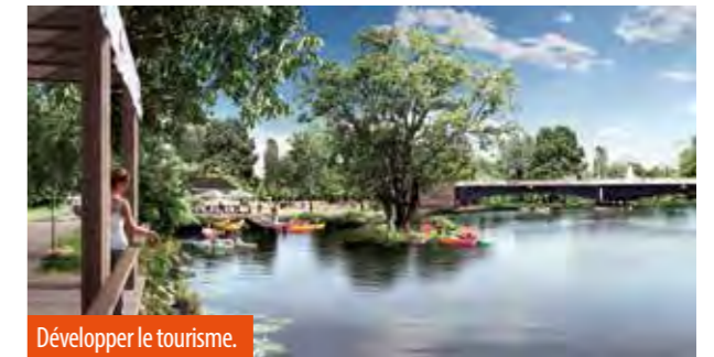
Développer le tourisme.

Ce projet est le plus avancé des cinq, la mission d'étude le concernant ayant démarré mi-février. Le secteur, en particulier la boucle des Isles, est le plus exposé aux risques d'inondation. Le projet devra tout à la fois proposer des solutions pour réduire sa vulnérabilité et pour penser son futur développement commercial et touristique, notamment en renforçant les activités de loisirs. Cela passe par l'amélioration de la desserte des lieux, que ce soit en direction du centre commercial Carré d'As, des guinguettes des bords d'Allier ou des campings. L'idée d'une passerelle piétonne et cyclable reliant les deux rives a été envisagée. Les projets d'aménagement devront s'appuyer sur le caractère et l'identité de chaque espace à l'intérieur de la boucle, les guinguettes au nord, les jardins familiaux au cœur et, plus au sud, la forêt fluviale. La renaturation de la rive gauche au profit des cyclistes et piétons, est un des enjeux de ce projet, associée à la recherche de mécanismes qui redonneraient à la rivière plus de latitude.