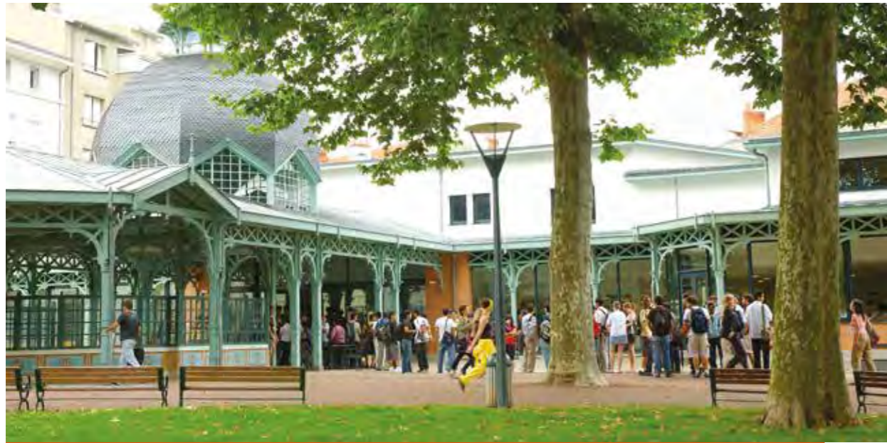
À la rentrée 2018, l'IFMK (Institut de formation de masso-kinésithérapie) s'installera sur le site des Docks de Blois rénové, à proximité du Pôle universitaire.

L'heure du choix a sonné pour les étudiants et futurs étudiants des formations santé qui ont régulièrement placé Vichy en tête de leurs vœux post-bac.