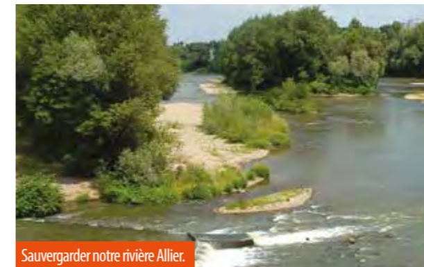
Sauvegarder notre rivière Allier.

Le projet a pour ambition de reconnecter le quartier de Port-Charmeil - situé au nord du pont-barrage de Vichy - à l'Allier à laquelle il tourne actuellement le dos. En rive droite sont envisagés un aménagement global de la zone commerciale, prenant en compte la prévention du risque inondation, une renaturation des berges actuellement envahies par des plantes invasives et le passage de la voie verte. Dans cette zone assez dégradée, la rivière pourrait retrouver un fonctionnement plus naturel, et ses abords devenir un espace de découverte pour les habitants. Un parc naturel urbain verrait le jour en rive gauche, adossé à la boire des Carrés, que traverserait un itinéraire cyclable et piéton. L'objectif là aussi serait de restaurer le milieu naturel fluvial. La protection de la nappe alluviale et des captages d'eau potable à l'aval s'en trouverait ainsi renforcée.