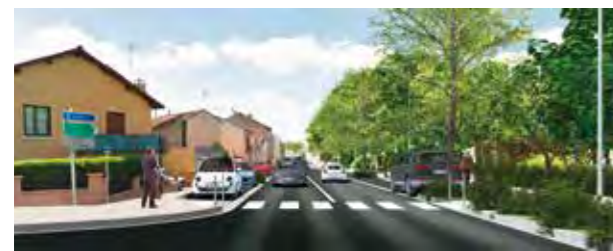
Côté Vichy, la rue de Bordeaux sera élargie.

Côté Vichy, la rue de Bordeaux sera élargie, arborée et des espaces de circulation pour piétons et cyclistes créés. La circulation de camions assurant une desserte locale est seule autorisée. Le square à l'angle du boulevard Denière sera entièrement rénové ainsi que l'avenue de la République entre le boulevard Denière et l'avenue de la Liberté. La fin des travaux est prévue pour 2017. Le coût total de l'opération est de dix millions d'euros.