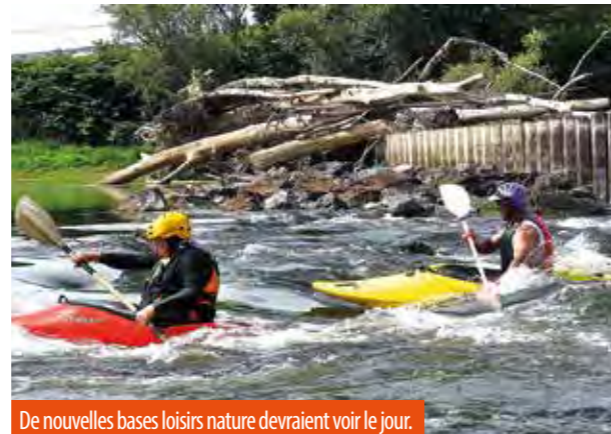
De nouvelles bases loisirs nature devraient voir le jour.

Aux portes de Saint-Germain-des-Fossés, l'étang « Jalicot », une ancienne gravière aujourd'hui dédiée à la pêche et à la voile, accueillerait une base de loisirs de nature. L'aménagement de ce secteur dit « des Isles », en bord de cours d'eau, devra tenir compte des spécificités du site. Le plan d'eau se trouve dans le lit majeur de l'Allier et pourrait capturer la rivière lors des épisodes de crue. Un tel phénomène accentuerait l'érosion en aval. Le respect du milieu naturel et de son fonctionnement impliquera la recherche de solutions innovantes. Les aménagements nouvellement créés seront reliés au centre-ville de Saint-Germain et à la commune de Billy qui porte le projet d'accéder au label « Plus beau village de France ». En contrebas du village qui devrait être desservi par la voie verte, futur itinéraire de découverte de la rivière, les bords d'Allier seront mis en valeur. Dans le même esprit est envisagée la renaturation du Mourgon, dont les rives sont envahies par la renouée du Japon, et de sa confluence avec l'Allier.