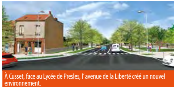
À Cusset, face au Lycée de Presles, l'avenue de la Liberté crée un nouvel environnement.

Pour répondre aux inquiétudes des riverains en matière de pollutions sonores, la voie, végétalisée, d'une largeur maximale de dix-huit mètres, sera dotée de murs anti-bruit placés à trente centimètres de la chaussée, afin de limiter à la source et au maximum le bruit de la circulation. L'avenue de la Liberté franchira ensuite le Sichon sur le nouveau pont construit à cet effet (juillet/décembre 2016), à hauteur de l'E. Leclerc Drive, et rejoindra le rond-point, lui-même réaménagé qui borde Renault Minute et le parking Carrefour. Elle traversera en diagonale le terrain en friche face à l'E. Leclerc Drive et débouchera sur un rond-point, à la jonction avec l'avenue Gilbert-Roux. La réalisation de ce dernier interviendra en mai/juillet 2017. L'accessibilité aux commerces sera maintenue à chaque étape du chantier et un fléchage mis en place.