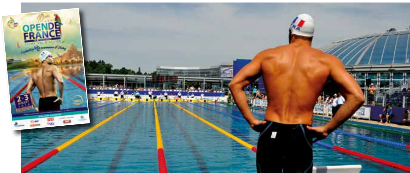
C'est au Stade aquatique, lors de l'Open de natation, que la star Florent Manaudou fera son dernier entraînement avant Rio.

L'Open de France de Natation est devenu le Rendez-vous de l'élite mondiale de ce sport, le premier week-end de juillet. Il se déroulera, cette année, les samedi 2 et dimanche 3 juillet au Stade aquatique de l'agglomération Vichy Val d'Allier et accueillera plus de 300 nageurs.