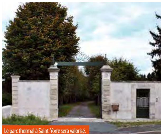
Le parc thermal à Saint-Yorre sera valorisé.

La mise en valeur et la redécouverte des sources et du patrimoine thermal de Saint-Yorre sont des axes majeurs du projet d'aménagement du pôle loisirs-tourisme de Saint-Yorre et Abrest initié par Vichy Val d'Allier. La réhabilitation du parc thermal Larbaud en sera une des pierres angulaires. Afin de valoriser ces différents éléments patrimoniaux du point de vue touristique, la création d'un circuit de découverte entre la cité saint-yorraise et Bellerive-sur-Allier, mais aussi Hauterive, Abrest, Mariol, Saint-Sylvestre-Pragoulin et Saint-Priest-Bramefant, et son raccordement aux chemins de randonnée de la Montagne bourbonnaise sont des pistes envisagées. L'étude intégrera également la relation à la rivière Allier et inclura le développement d'une base sportive dédiée au canoë-kayak en rive gauche, au sud de l'agglomération.