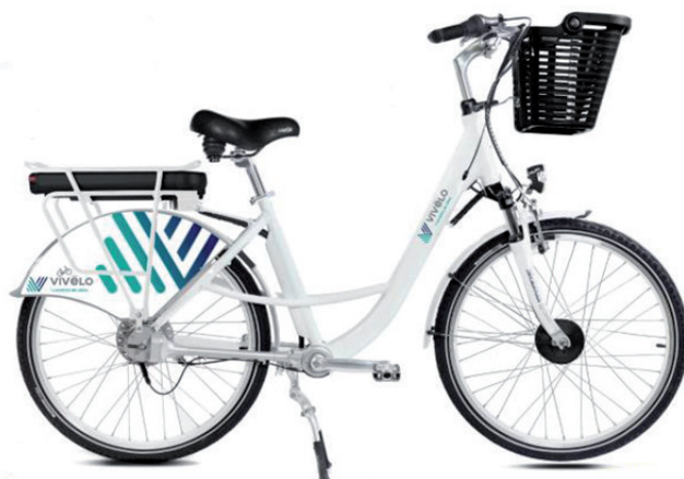
Vélo à assistance électrique