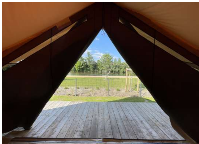
photo intérieure des lodges